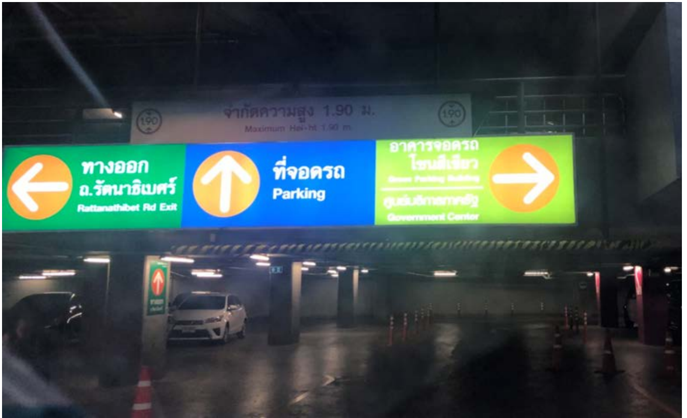
สังเกตป้าย โซนสีเขียว